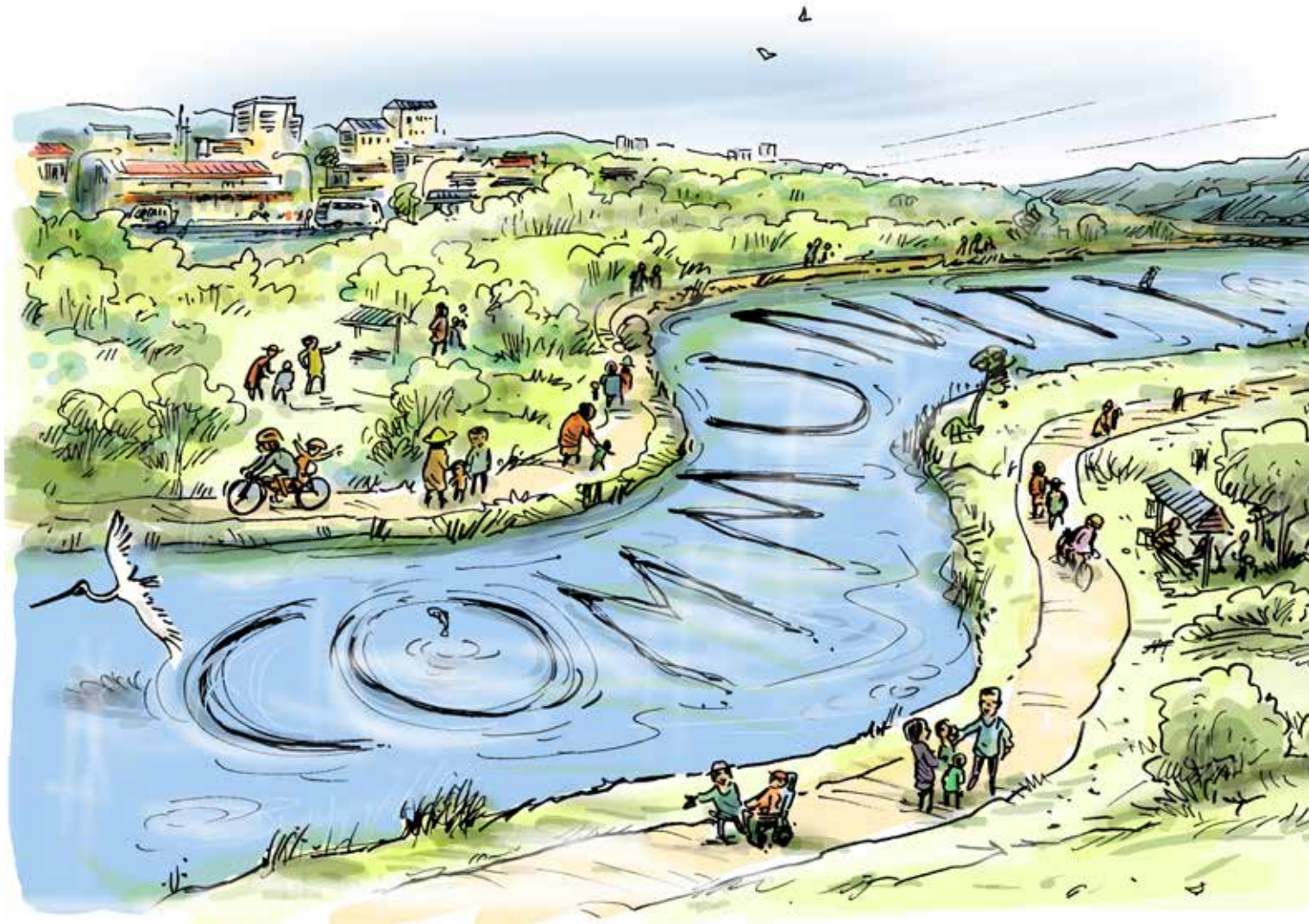
Εικονογράφηση Simon Kneebone