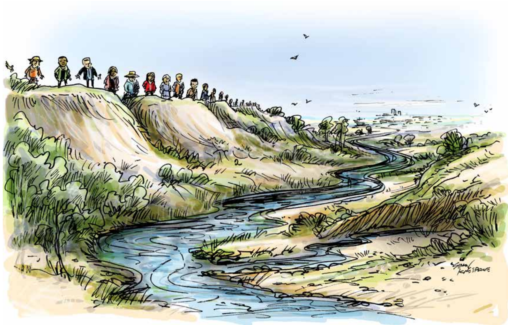
Εικονογράφηση Simon Kneebone