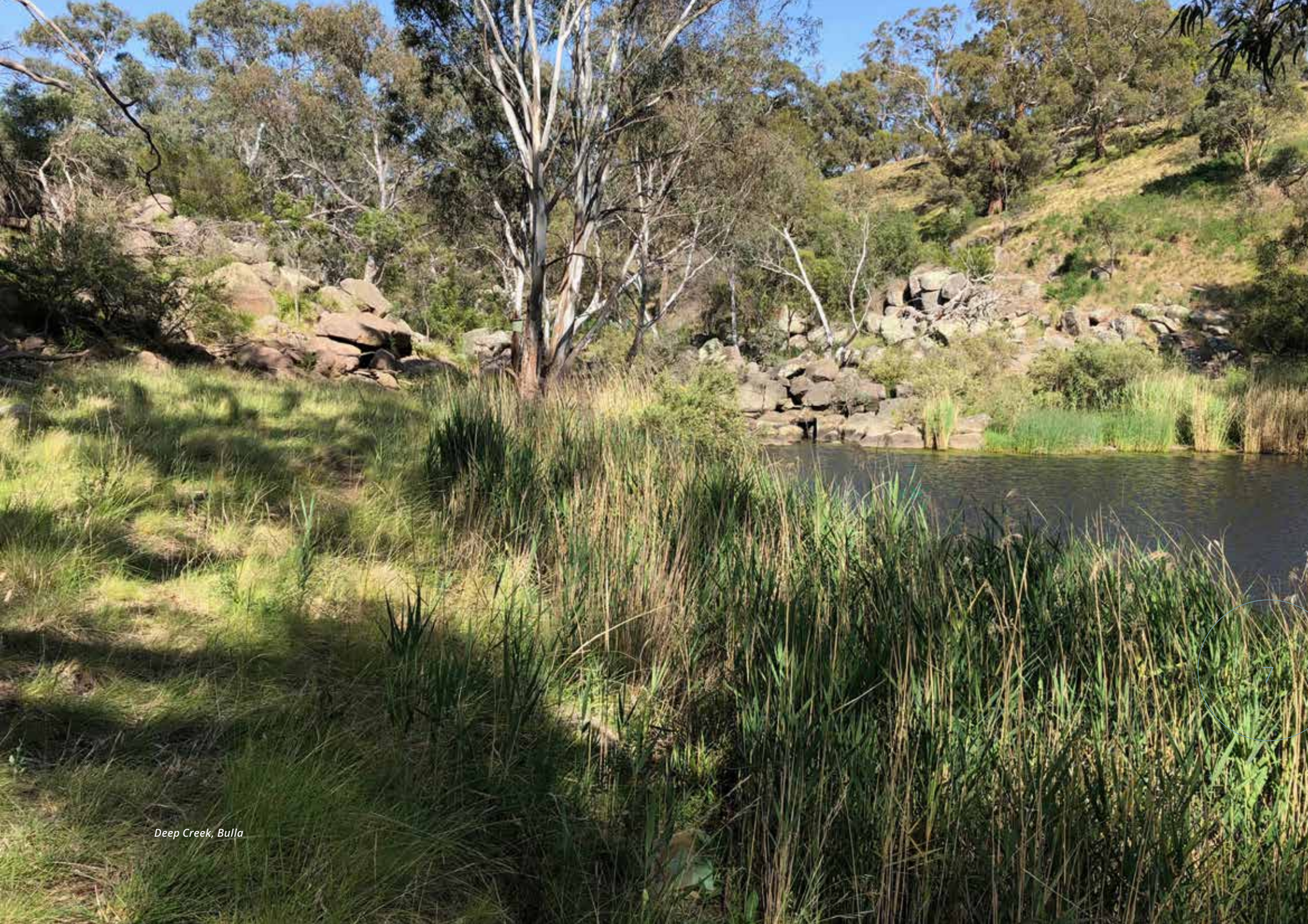
Deep Creek, Bulla