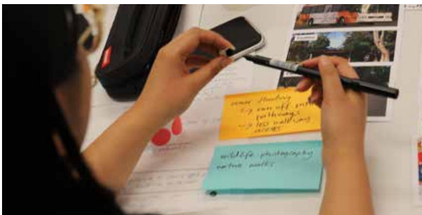
Εργαστήρια της κοινότητας CALD