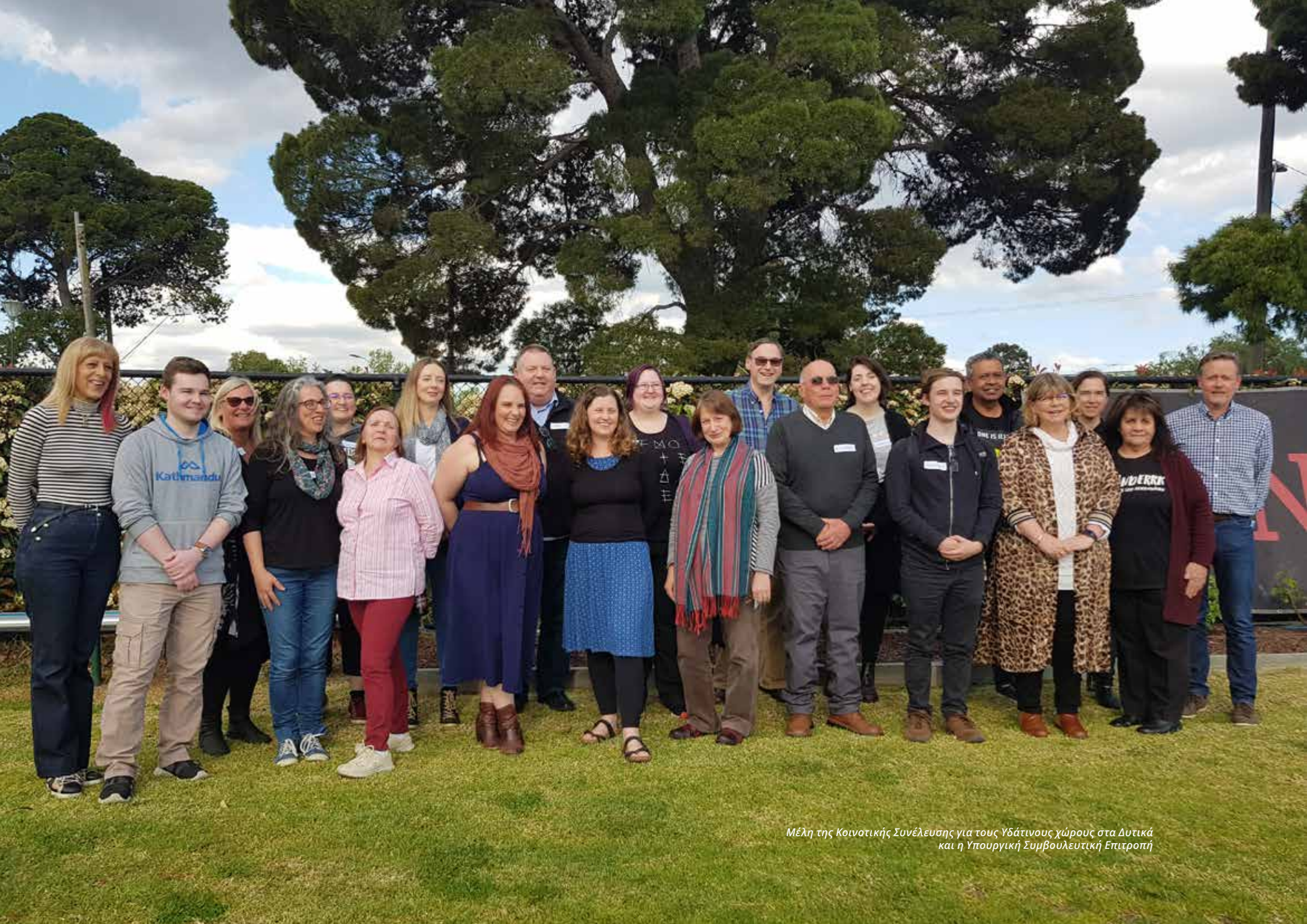
Μέλη της Κοινοτικής Συνέλευσης για τους Υδάτινους χώρους στα Λυτικά και η Υπουργική Συμβουλευτική Επιτροπή