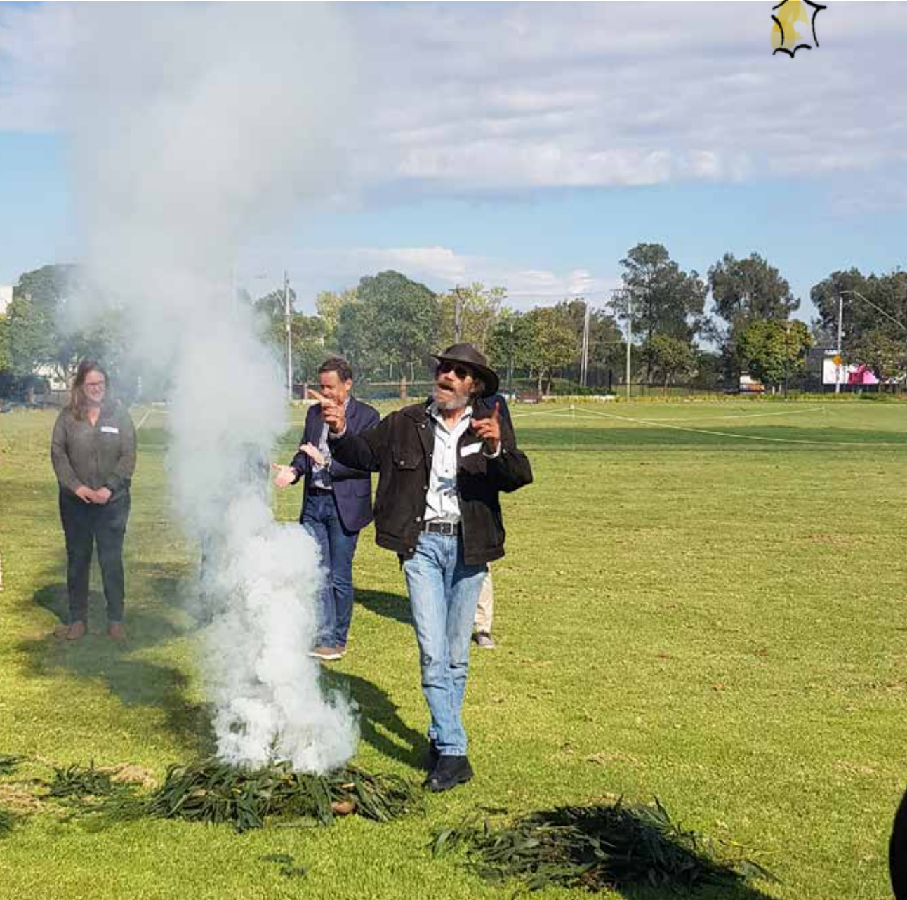
Γέροντας Wurundjeri Woi wurrung, ο Θεός Ντέιβ, σε τελετή καπνίσματος στη Συνέλευση

Η Συνέλευση διαβουλευτήκε και απάντησε στην ερώτηση: ποιο πρέπει να είναι το Όραμά μας γι' αυτούς τους υδάτινους χώρους μέχρι το 2070 ; Σε χρονική περίοδο δύο ημερών, τα μέλη της Συνέλευσης άκουσαν τους ειδικούς των υδάτινων χώρων, τους ηγέτες της κοινότητας και τους μαθητές. Άκουσαν τους Παραδοσιακούς Ιδιοκτήτες των Λαών Wurundjeri Woi wurung και Wadawurrung, έμαθαν για τη συνεχή σύνδεσή τους με την τον Τόπο και την πολιτιστική σημασία της περιοχής ως μοναδικό, διασυνδεδεμένο ζωντανό σύστημα. Μετά το πέρας των δύο ημερών, η Συνέλευση ένωσε την ανάγκη να επανέλθει για την οριστικοποίηση του Οράματος. Στην τελική συνάντηση έλαβαν μέρος 21 μέλη της Συνέλευσης, που ένωσαν τις προηγούμενες εμπειρίες τους, εξερεύνησαν τα αποτελέσματα της συμμετοχής των Πολιτισμικά και Γλωσσικά Διαφοροποιημένων ομάδων και πέρασαν περισσότερο χρόνο με τους Παραδοσιακούς Ιδιοκτήτες, για να καταλήξουν σε ειλικρινή οράματα για τους Waterways of the West.