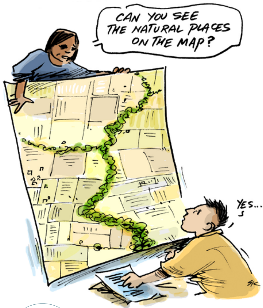
Εικονογράφηση Simon Kneebone