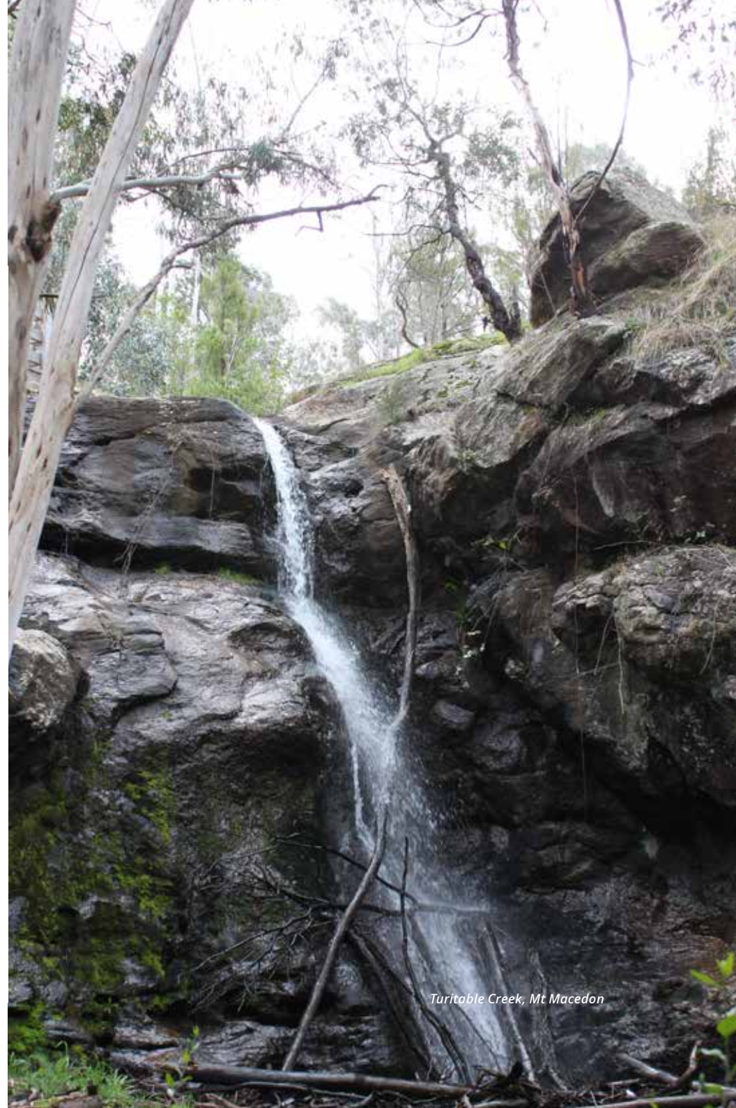
Turitable Creek, Mt Macedon